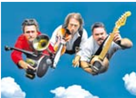
Recykling: Schrott zu Musik.

Hits, Highlights und Heroen. In den themenorientierten Kleinkunstwochen finden sich alle Genres der Kleinkunst wie z.B. Comedy, Kabarett, Musik- oder Figurentheater. Mit dabei sind gute Bekannte aber auch Neuentdeckungen: Lutz Görner, Derevo, Yellow-Hands, Herr Niels, The Willi, Konrad Beikircher, Familie Flöz und Dacapo. Tel.: 02304/104-811. www.schwerte.de