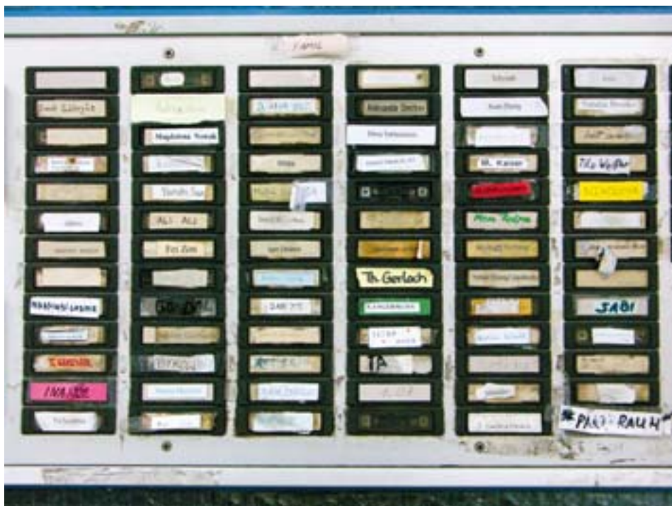
MELEZ.08 - Geschichten vom Zusammenleben.