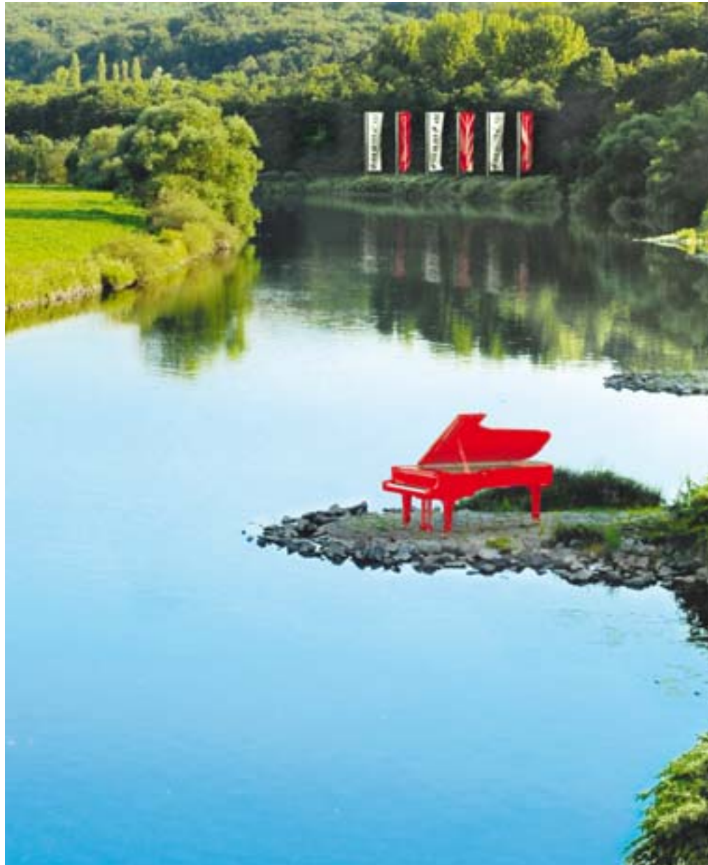
Klavierfestival Ruhr. Plakatmotiv.

Dortmund ist Schauplatz der 26. Auflage des Kinder- und Jugendtheatertreffens NRW. Das Festival gilt als das wichtigste Zusammenkommen der Kinder- und Jugendtheaterszene in Nordrhein-Westfalen. Es nehmen zahlreiche Stadt- und Landestheater sowie freie Spielensembles teil. Tel.: 0231/50-27222. www.theaterdo.de