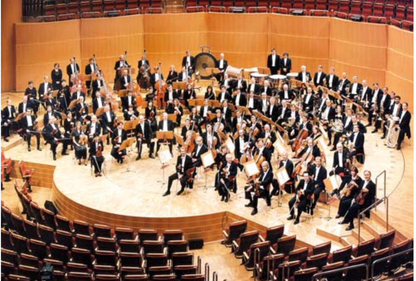
25. Tage Alter Musik in Herne. WDR-Sinfonieorchester Köln, Brad Lubman (Ltg.).