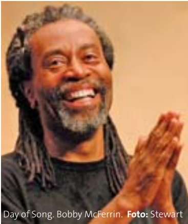
Day of Song, Bobby McFerrin.