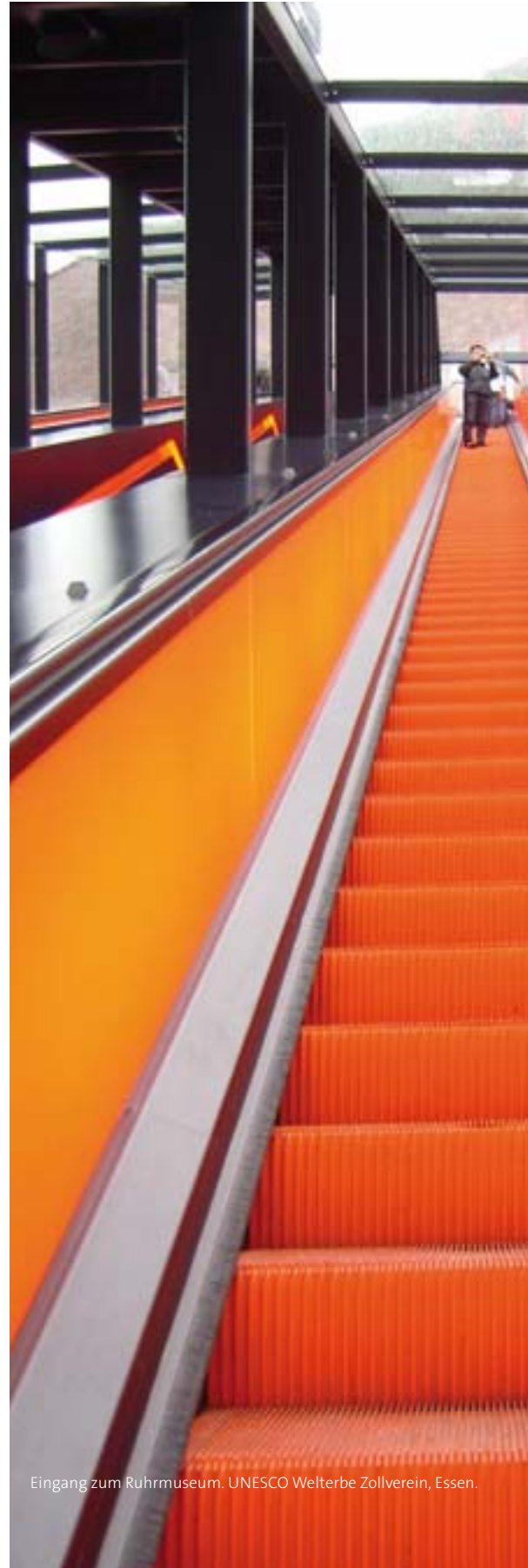
Eingang zum Ruhrmuseum. UNESCO Welterbe Zollverein, Essen.

Metropole Ruhr, die den Titel Kulturhauptstadt eigentlich jedes Jahr verdient hätte.