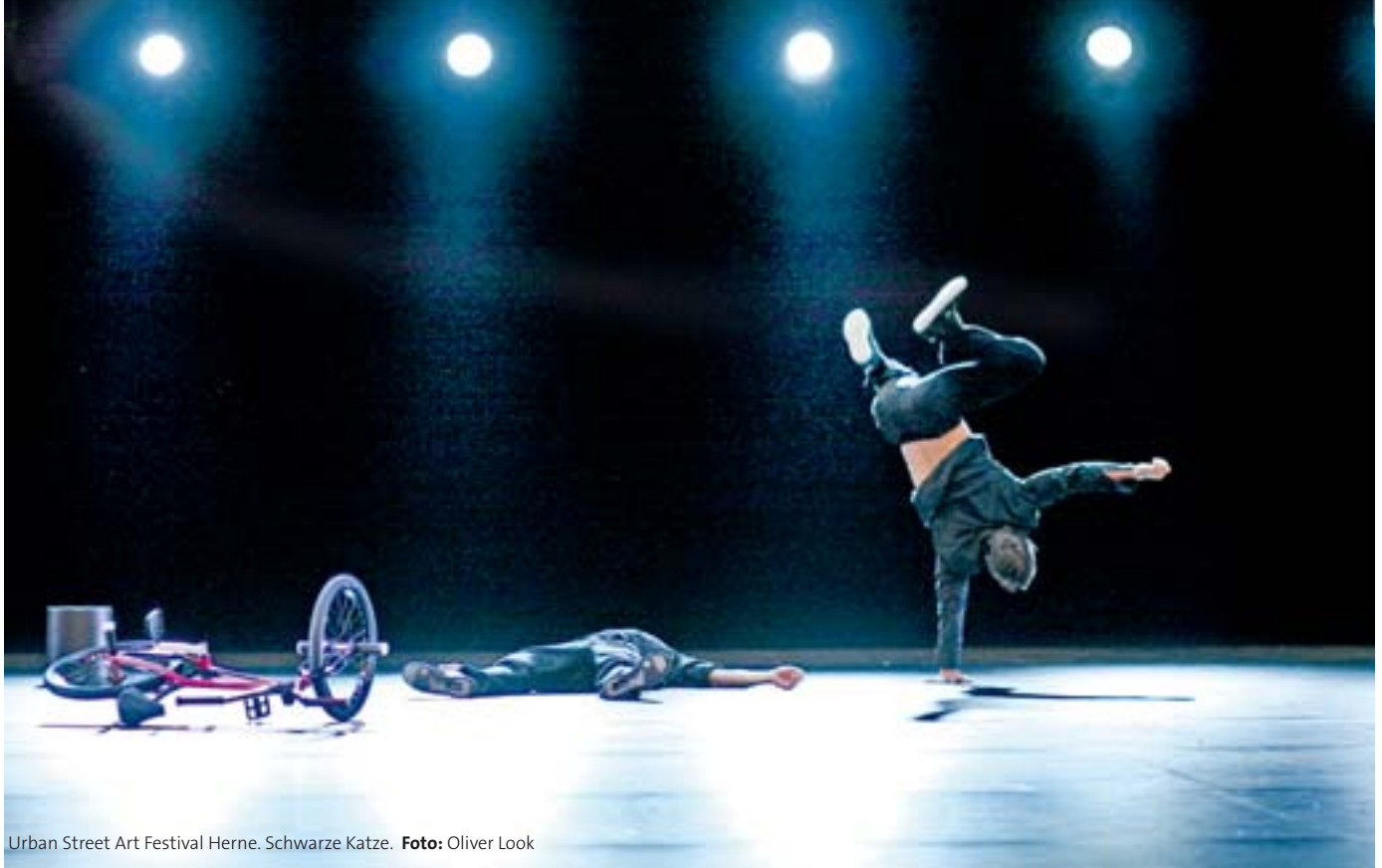
Urban Street Art Festival Herne. Schwarze Katze.