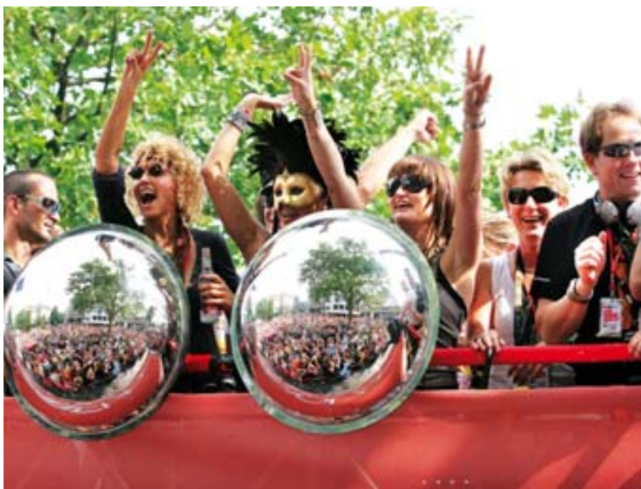
Loveparade Duisburg.

Duisburg hat grünes Licht gegeben: Die Loveparade 2010 - sie wird stattfinden, das ist ganz gewiss! Der Termin allerdings: unter Vorbehalt! Zentraler Veranstaltungsort für die größte Raverparty der Welt soll auf jeden Fall das Gelände der künftigen „Duisburger Freiheit“ am Hauptbahnhof werden. Mit diesem Love-Weekend wird das Ruhrgebiet wieder einmal alle Grenzen sprengen. Auch die Clubszene der gesamten Metropole Ruhr ist aktiv in das Ereignis Loveparade eingebunden. DJ's aus der ganzen Welt treten auf und präsentieren alle Facetten der elektronischen Tanzmusik – von Trance und Techno über House bis Minimal. Tel.: 030/2000-42333. www.loveparade.de