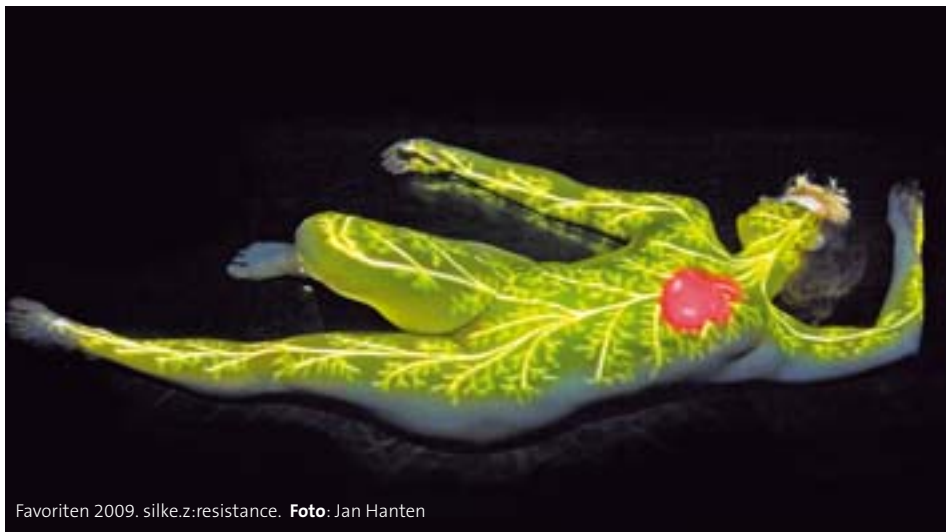
Favoriten 2009. silke.z:resistance.

In diesem Jahr präsentiert das etablierte Dortmunder Theaterfestival unter dem Titel „Theaterquartier Ruhr 2010“ erstmalig eine temporäre, europäische Produktionsstätte der Künste, in der ausgewählte Künstler und Gruppen aus NRW und Europa eine Arbeitsbasis finden. Neben den Favoriten wird in Zukunft jeweils die Werkschau eines Künstlers / einer Künstlergruppe präsentiert. Den Anfang machen der Düsseldorfer Künstler VA Wölfl und seine Kompanie NEUER TANZ mit einer RE:EDITION ausgewählter Produktionen, einer raumspezifischen Installation und einer Uraufführung. Tel.: 0231/55-752116. www.favoriten10.de