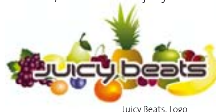
Juicy Beats. Logo

Das größte Festival für elektronische und artverwandte Musik im Ruhrgebiet. Im Dortmunder Westfalenpark warten viele Dancefloors und Livebühnen. Die Besucher können bis tief in die Nacht – 16 Stunden lang – die angesagtesten DJ's und Live-Acts sowie Videoinstallationen genießen. Tel.: 0231/7282429. www.juicybeats.net