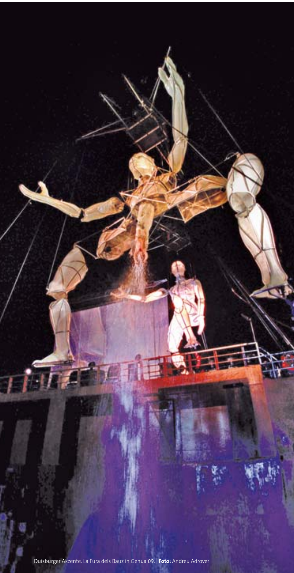
Duisburger Akzente. La Fura dels Bauz in Genua 09.