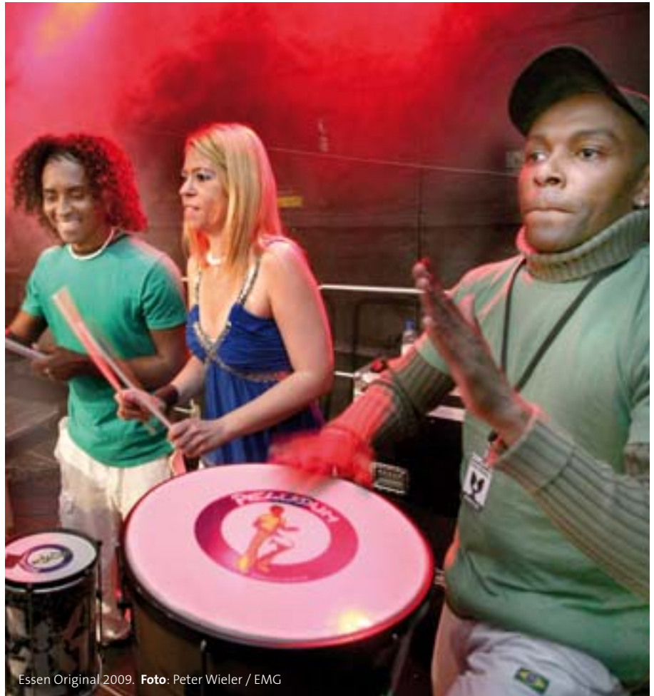
Essen Original 2009.

Das kleine, feine Festival FIDENA (Figurentheater der Nationen) gehört zu den ältesten Theaterfesten Deutschlands und gilt als eines der bedeutendsten Festivals seiner Art in Europa. Stets am Puls der Zeit der aktuellen Ausdrucksformen, befindet es sich auf der Grenze zwischen darstellender und bildender Kunst. Auch in diesem Jahr gibt es ein prall gefülltes Festivalprogramm mit Puppen-, Objekt- und Materialtheater ebenso wie Bewegungstheater oder Performances mit Aufführungen in verschiedenen Bochumer Spielstätten. Tel.: 0234/47720. www.fidena.de