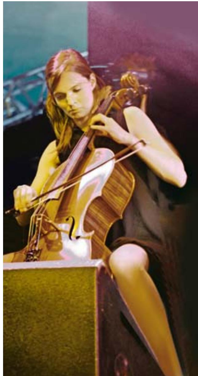
moers festival (Valgeir Sigurosson & Band 2009).

Das spartenübergreifende Duisburger Festival „Akzente“ setzt sich alljährlich mit einem gesellschaftlich oder kulturpolitisch aktuellen Thema auseinander. Unter dem Motto „Ruhrort(t)räume“ wollen die Akzente Ruhrort 2010 in eine einzigartige Bühne verwandeln. Mit Theater, Musik, Film, Literatur und Kunst sollen besondere Orte dieses Stadtteils zum (Er)Leben gebracht oder in Erinnerung gerufen werden. Und kein Ort wird vor den Inszenierungen, den Performances und den Kunstaktionen der Kulturschaffenden szenisch sicher sein (Eröffnung mit: La Fuera dels Baus). Neben dem Schwerpunkt in Ruhrort werden die Akzente weiterhin stadtweite Veranstaltungen anbieten, darunter das traditionsreiche Theatertreffen im Stadttheater sowie Ausstellungen im Kultur- und Stadthistorischen Museum und in der Stiftung Wilhelm Lehmbruck Museum. Tel.: 0203/94-000. www.duisburger-akzente.de